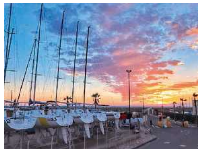
秋の空は飽きないなあ (11/7 @hayama_official)

様々なヨットが並ぶ葉山港で、広い空に浮かぶうろこ雲が夕日に染まる瞬間を撮影しました。寒くなるにつれて空気は澄むので、これから冬にかけてさらに素敵な景色に出会えそうです。